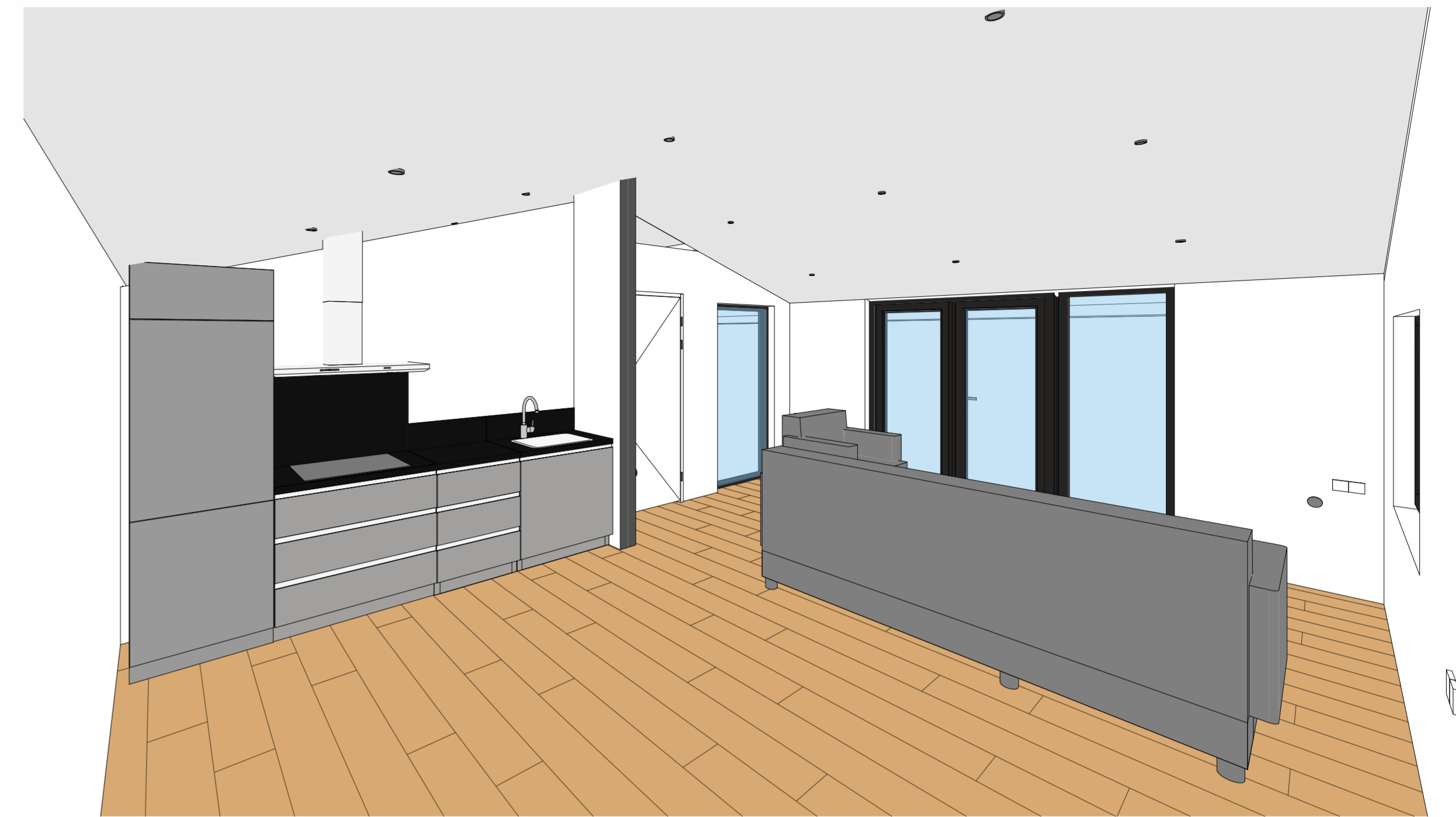
PERSPECTIEF - 1