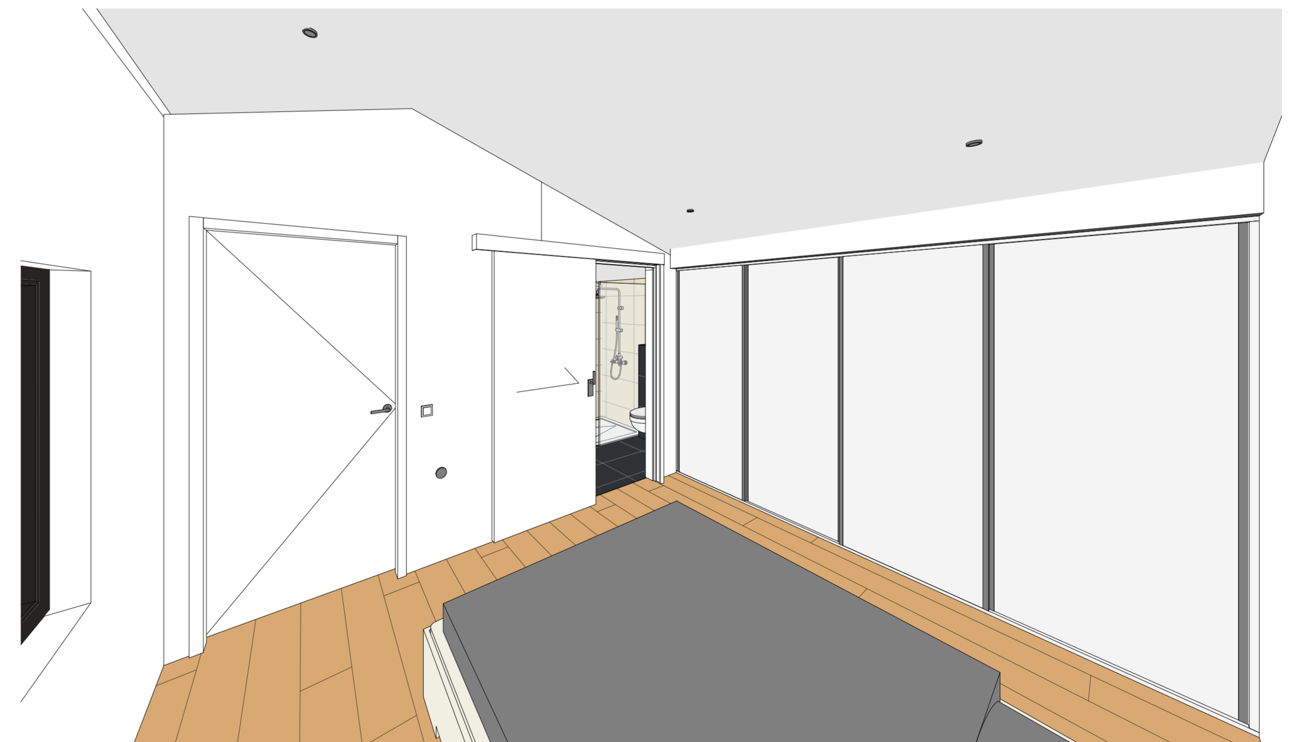
PERSPECTIEF - 2